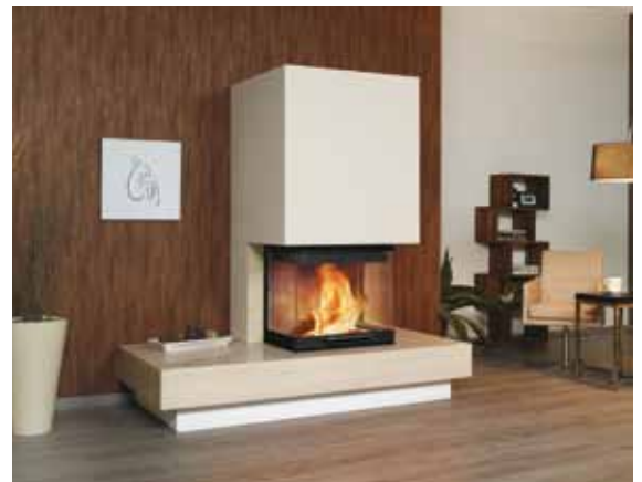
1/189.0 mocca-creme poliert