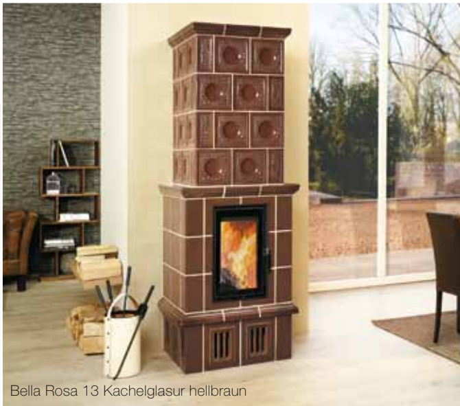
Bella Rosa 13 Kachelglasur hellbraun