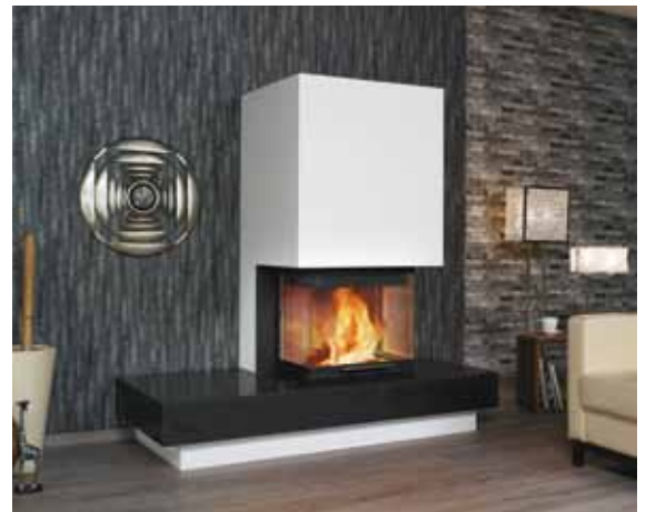
1/189.0 nero-assoluto satiniert