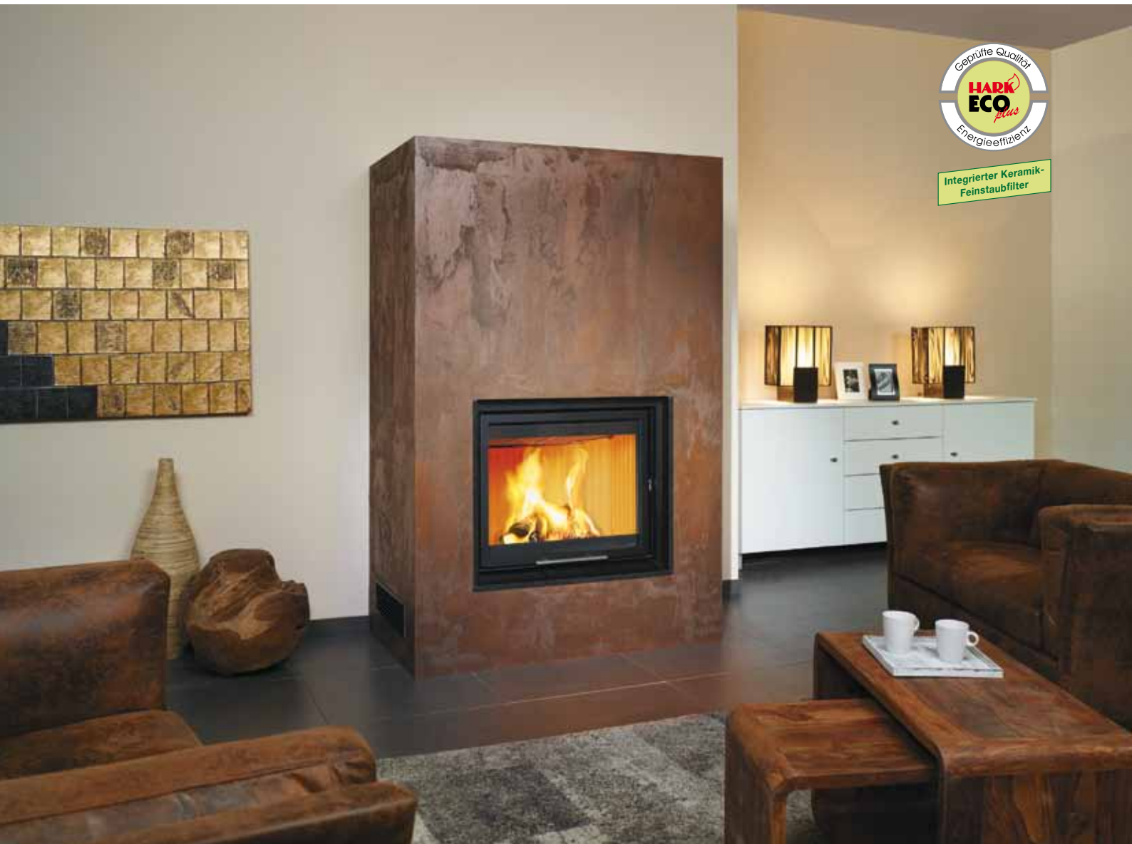
Oberflächendesign Kreativfarbe Rost-Optik, Tim Mälzer / Alpina