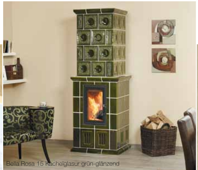
Bella Rosa 15 Kachelglasur grün-glänzend