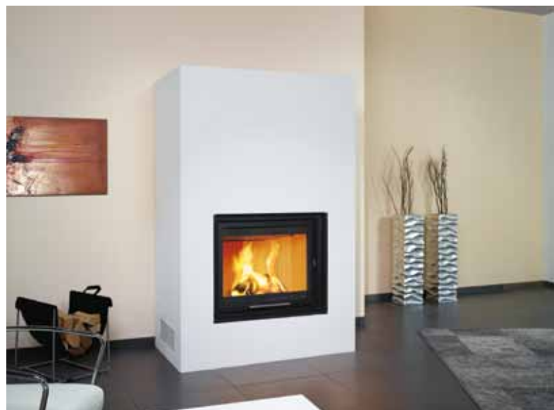
1/182.0 Einfassung nero-assoluto, Oberfläche weiß gestrichen