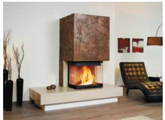
1/189.0 mocca-creme poliert Oberflächendesign Kreativfarbe Rost-Optik Tim Mälzer/Alpina