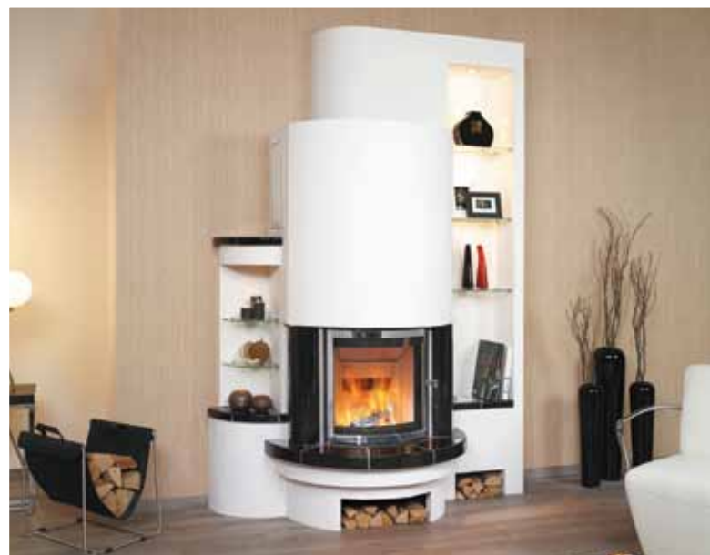
3/212.4 Kachelglasur schwarz-glänzend