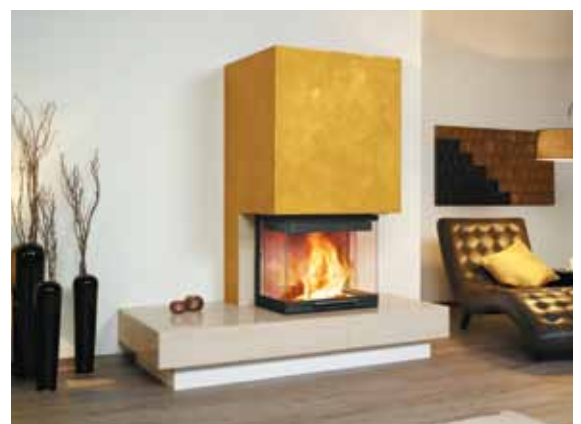
1/189.0 mocca-creme poliert Oberflächendesign Kreativfarbe Goldrausch Tim Mälzer/Alpina